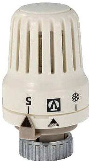
ГОЛОВКА ТЕРМОСТАТИЧЕСКАЯ ЖИДКОСТНАЯ

Производитель: VALTEC s.r.l., Via Pietro Cossa, 2, 25135-Brescia, ITALY